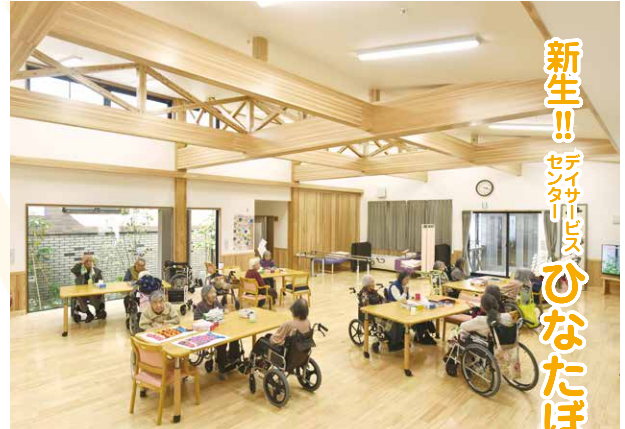
解放感溢れる明るいメインフロア