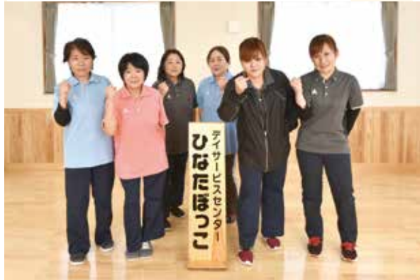
地域で親しまれる施設を目指して頑張ります！