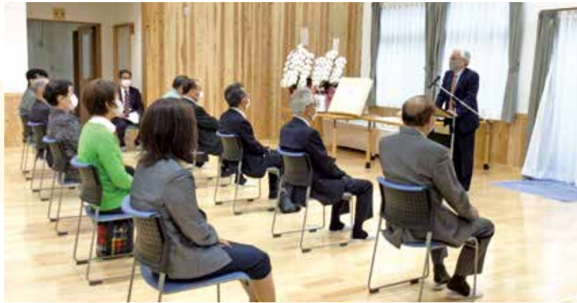
理事、評議員、監事や関係者の方々をお招きして落成式を開催