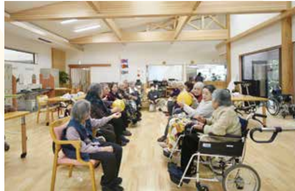
新しい施設でレクリエーションを楽しむ利用者の皆さま