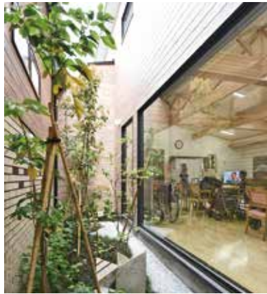
やさしく光が差し込む中庭